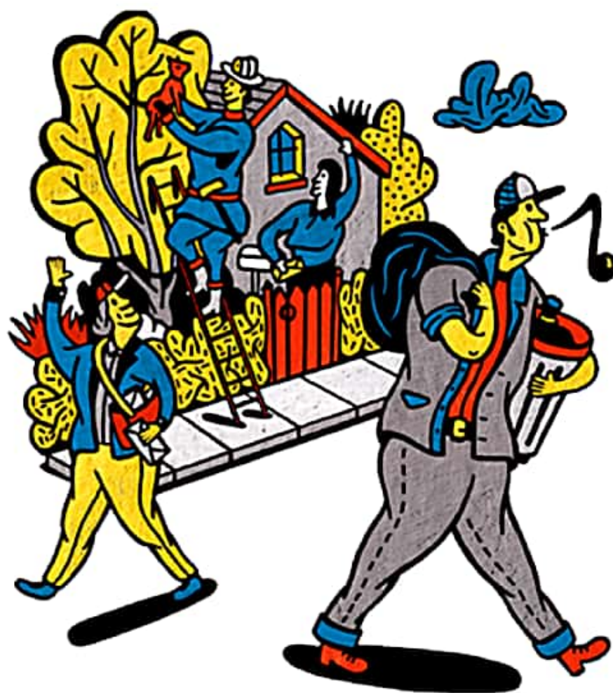
Ilustração: Phil Wrigglesworth / Jacobin

Não, Socialismo não é só sobre mais governo – é sobre propriedade e controle democráticos.